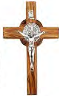
Thánh giá Thánh Benêđictô