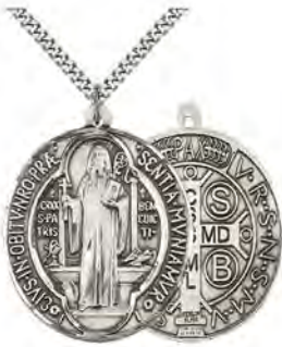
Mẻ đay Thánh Benêđictô

nguyện dễ thấy trong phòng của bạn và sử dụng nó hàng ngày. Làm dấu Thánh giá khi bạn bị cám dỗ. Mang mẽ đay Benedict, mẽ đay Đức Mẹ huyền nhiệm, hoặc cây Thánh giá. Cầm trong tay chuỗi Mân Côi. Đặt một số hình ảnh thánh trên tủ đầu giường của bạn. Đây không phải là những món đồ mê tín lật vặt. Các nhà trừ quỷ sử dụng chúng là có lý do. Nếu bạn khó đi vào giấc ngủ, hãy xem xét điều gì có thể gây ra sự bồn chồn của bạn và cố gắng giải quyết vấn đề đó một cách riêng biệt, thay vì chuyển sang hành vi dâm dục để xoa dịu tâm trí. ( Video cho ngày 21 )