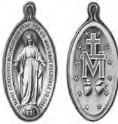
Mẻ đay Đức Mẹ huyền nhiệm